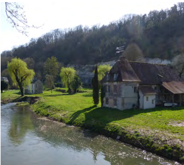
Les bords de l'Eure

L'espace rural est depuis un demi-siècle soumis à des phénomènes d'ordre métropolitain. Ses territoires sont traversés par des flux de plus en plus intenses. Sa planification et sa gouvernance sont conditionnées par des centralités de plus en plus fortes, des compétences techniques de plus en plus mutualisées. Ses formes bâties, neuves et anciennes, s'homogénéisent et ses paysages se banalisent. En conséquence, la nature de la campagne, historiquement agricole, s'est multipliée : résidentielle dans les zones périurbaines et touristiques, qualifiée de nouvelle quand elle accueille de nouveaux types de résidents, venus d'autres horizons, ou fragile lorsqu'elle conserve son affectation première. Mais en dépit de ces phénomènes, la mort du rural ne peut être constatée. Bien au contraire, loin de subir sans réagir à la métropolisation, ses habitants, ses acteurs s'en nourrissent. Soucieux de préserver un cadre de vie plébiscité mais perpétuellement menacé, de conforter une valeur économique réelle en dépit des effets de la mondialisation, ils mettent en place des alternatives aux dysfonctionnements, aux obstacles et expérimentent de nouvelles pratiques. Ce sont ces initiatives, et ce dans trois domaines essentiels : les flux et les mobilités, la concertation et les formes bâties, que les 6 èmes rencontres mettent en valeur à travers conférences, expositions, visites de terrain et journée scientifique.