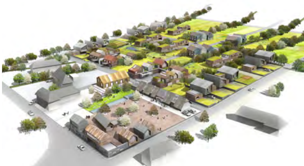
OHISOM ARCHITECTES - Prairie urbaine - Sheep meadow - Projet mentionné