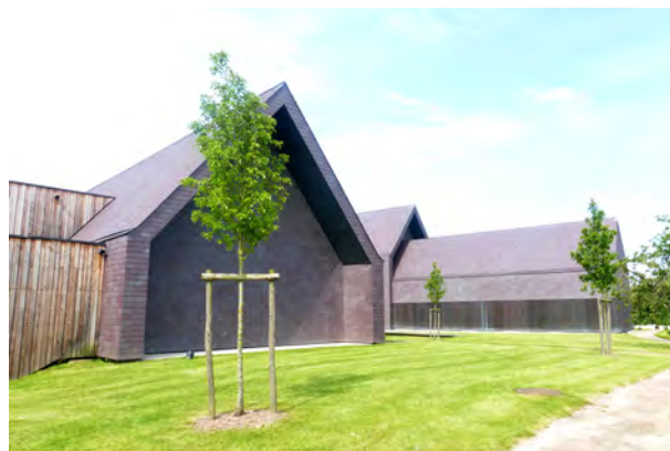
L'Atelier, médiathèque de Gournay-en-Bray / AAVP Architecture