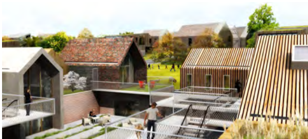
OHISOM ARCHITECTES - Prairie urbaine - Sheep meadow - Projet mentionné

Exposition des projets lauréats de l'appel à idées Habiter le Pays d'Auge au XXI e siècle organisé par Pays d'Auge Expansion et le CAUE du Calvados (2011)