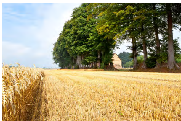
Clos-masure du Pays de Caux